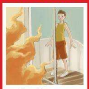
Если выйти невозможно, найти источник свежего воздуха