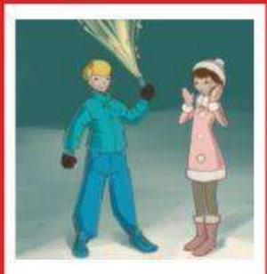
Нарушение мер предосторожности при запуске фейерверков