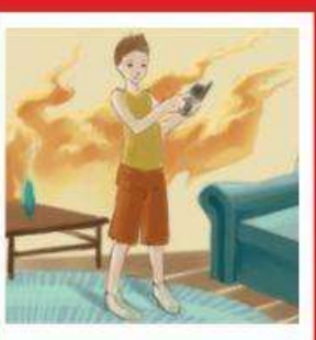
Вызвать пожарных по телефону 01