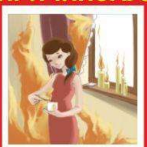
Игры с огнем