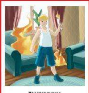
Неосторожное обращение с огнем