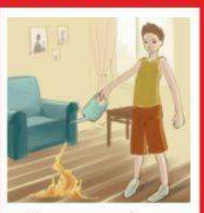
Мелкое возгорание быстро потушить подручными средствами