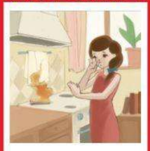
Неправильное пользование газовыми и электрическими плитами