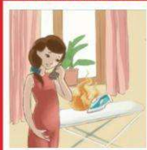
Электроприборы, оставленные без присмотра