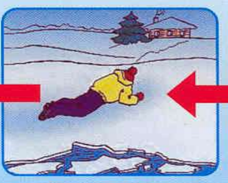
Проползти 3-4 метра по своим следам