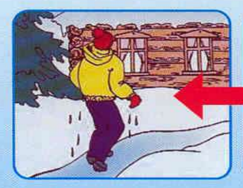
Не отдыхая, бежать к близкому жилью