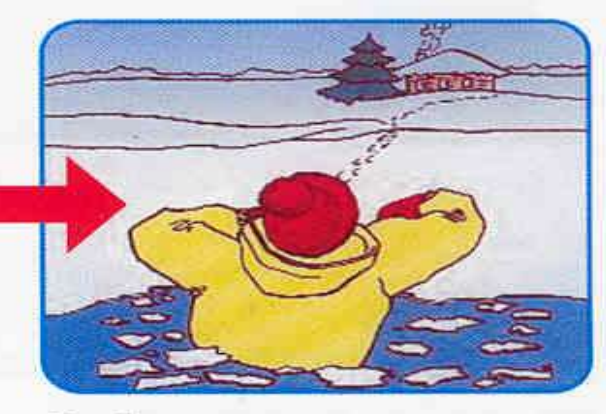
Выбираться в сторону, с которой произошло падение