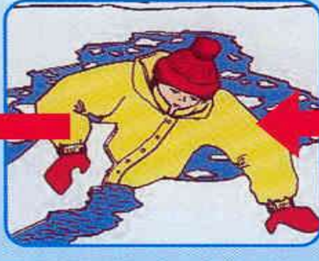
Забросить на лед ногу, откатиться от полыньи